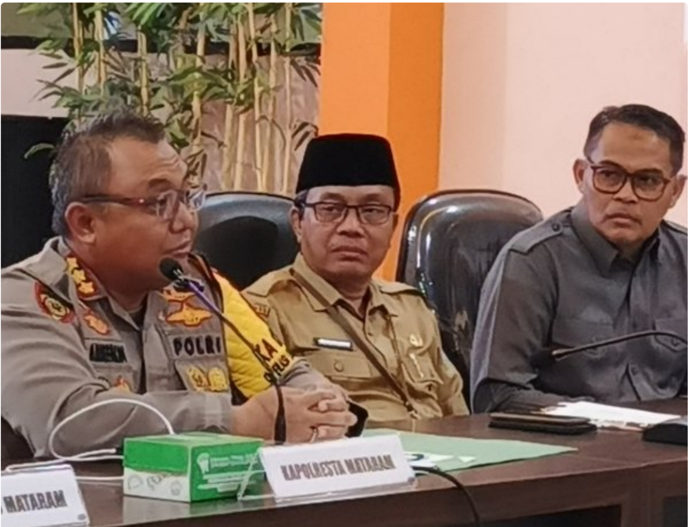
Kapolresta Mataram (Kiri) saat memimpin Konferensi pers akhir tahun, Selagi (31/12/2024)

MATARAM, NTB – Polresta Mataram mengakhiri tahun 2024 dengan menggelar Konferensi Pers Akhir Tahun, sebuah forum transparansi untuk memaparkan capaian dan inovasi yang telah dilakukan selama satu tahun. Kegiatan yang